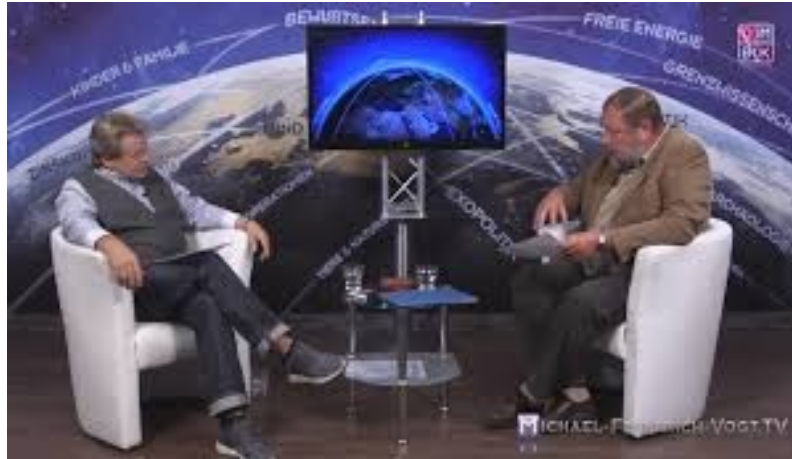
Der Hereroaufstand 1904: Völkermord oder Kriegspropaganda?